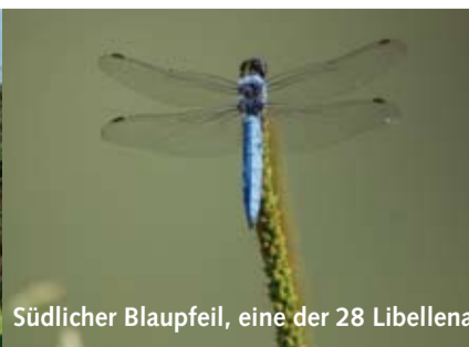
Südlicher Blaupfeil, eine der 28 Libellenarten