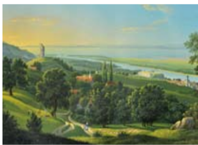
Mündung des Alpenrheins in den Bodensee mit dem Städtchen Rheineck am rechten Bildrand

entdeckt hatten. Die Gesamtausgabe der Rheinreise von den Quellen des Vorder- und Hinterrheins in Graubünden bis zur Mündung in die Nordsee bei Rotterdam entstand in den Jahren 1827 bis 1842/43. Vorarbeiten reichen bis in die Jahre 1817/18 zurück. Nach der künstlerischen und ver-