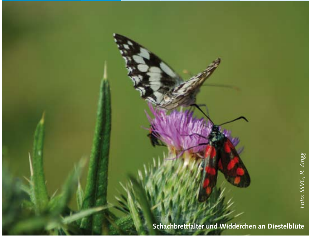
Schachbrettfalter und Widderchen an Diestelblüte