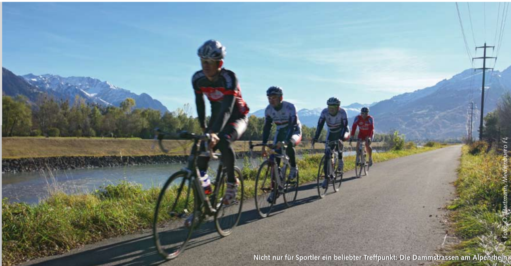
Nicht nur für Sportler ein beliebter Treffpunkt: Die Dammstrassen am Alpenrhein

Landeshauptmann Sausgruber betont die Wichtigkeit der grenzüberschreitenden Zusammenarbeit am Alpenrhein. Er unterstützt vor allem die laufenden Arbeiten der Internationalen Rheinregulierung IRR zur Verbesserung des Hochwasserschutzes und auch der Gewässerökologie. Ein Aufgabenschwerpunkt der IRKA in den nächsten Jahren ist für ihn auch die Verbesserung der Hochwasservorhersage am Alpenrhein. «Die im Entwicklungskonzept Alpenrhein empfohlenen Massnahmen werden schrittweise nach den definierten Prioritäten umgesetzt werden», betont Sausgruber.