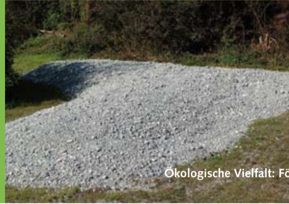
Ökologische Vielfalt: Föhrenwiesenwald, Tümpel mit Verlandungszone, Kiesfläche, ausgelichtetes Kleingehölz